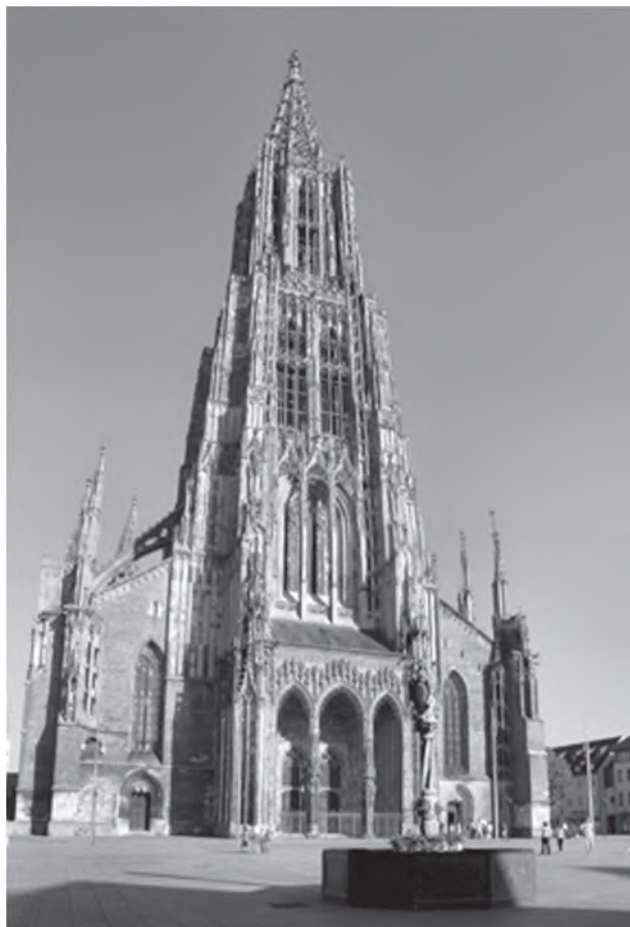
Илл. 4. Готический собор (Ульм, Германия)