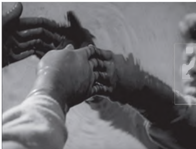
Илл. 2. Проход через зеркало («Орфей»)

(монады Аполлона), сдерживающий саморасточение Диониса. По Проклу, «Орфей противопоставляет царю Дионису аполлонийскую монаду, отвращающую его от нисхождения в титаническую множественность и от ухода с трона и берегущую его чистым и непорочным в единстве» (Цит. по: Иванов Вяч. Дионис и прадиионисийство . СПб.: Алетейя, 1994, С. 167).