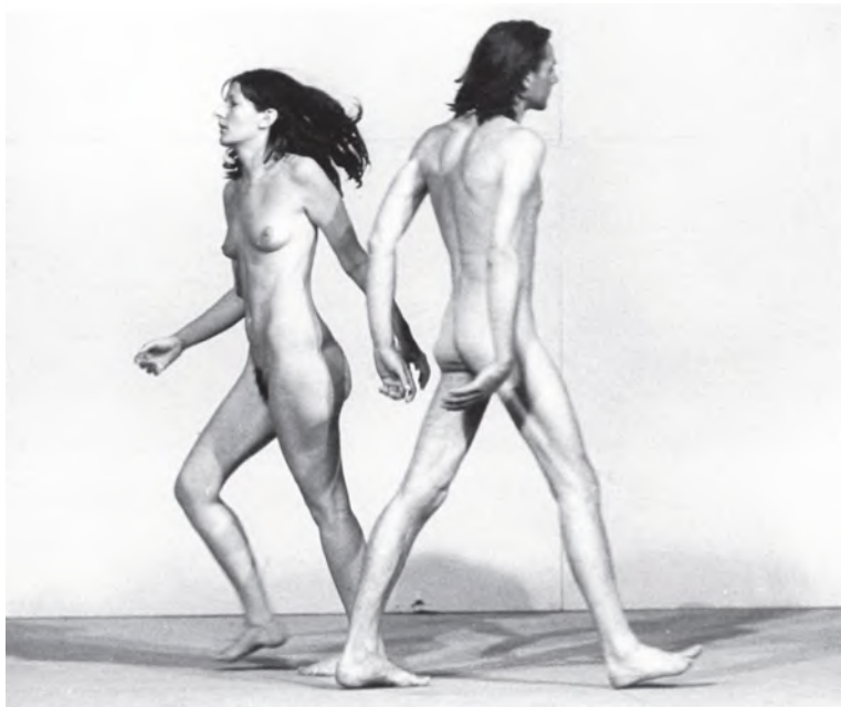
Илл. 5. Марина Абрамович и Улей "Relation in Space" Илл. 6. Марина Абрамович и Улей "Relation in Time"