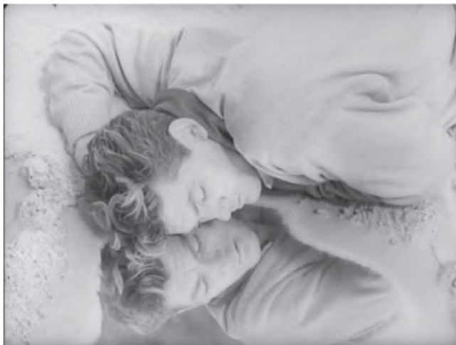
Илл. 1. Орфей (Жан Марэ) на границе двух миров («Орфей»).