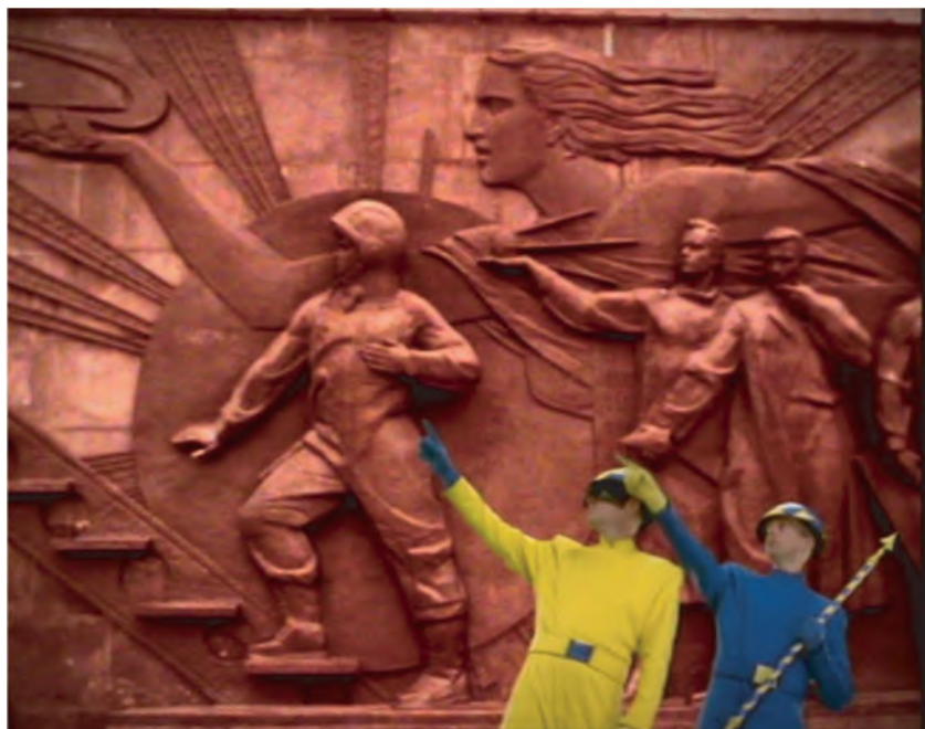
Илл. 9. "Go West" (Pet Shop Boys)