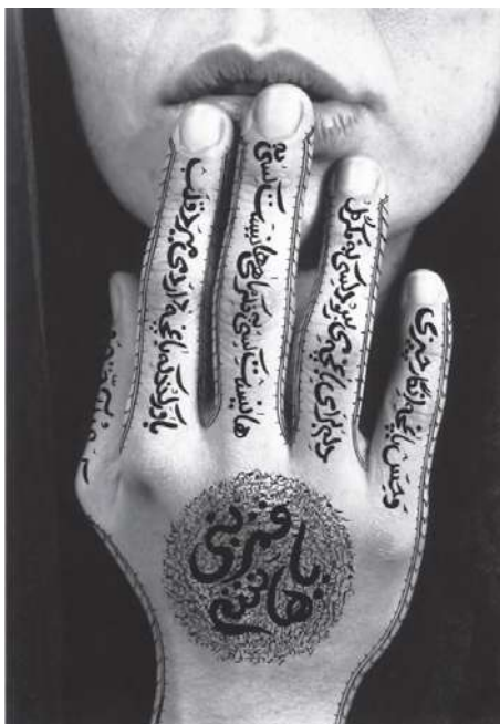
Илл. 8. Ширин Нешат “Lesbo”

Автор выражает благодарность Ширин Нешат за любезное разрешение использовать фотографии