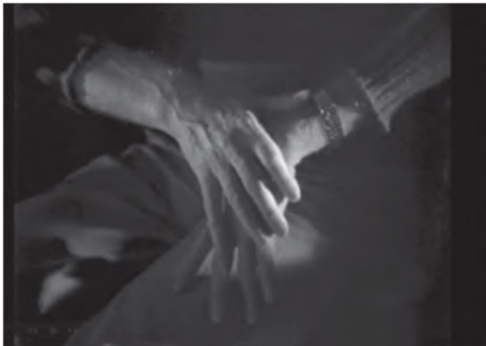
Илл. 21. Неготовность к полету

Андрей Тарковский видел в кино возможность «запечатлеть время»: