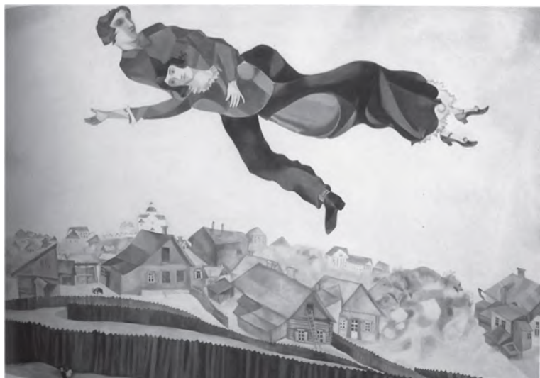
Илл. 15. Марк Шагал «Над городом»

перешагнувшая порог его дома. Доротея пугается кровавой истории, которую считывают с сабли ее пальцы. Образ сабли, отсутствующий в повести, но появившийся в фильме, становится знаком насилия и предвестником смерти героини. Как и живописный ряд в фильме Тарковского «Солярис», отраженная в зеркале картина Шагала поднимает вопрос о соотношении искусства и реальности: картина, вернее, ее зеркальное отражение, обнаруживает страшную правду о смерти героини до того, как Антоний увидит девушку мертвой. Вслед за отражением картины Шагала на экране возникает еще одно отражение: головы Антония в стекле, покрывающем картину, – тень убийцы (илл. 15, 16). В итоге, именно сабля становится той уликой, которая заставляет генерала, ведущего расследование смерти Доротеи, заподозрить Манева в причастности к убийству. Несмотря на то, что обвинения генерала оказываются несостоятельными, Манев приходит к мысли, что он и есть убийца, погубивший Доротею «своим ничтожеством и слабостью» (100).