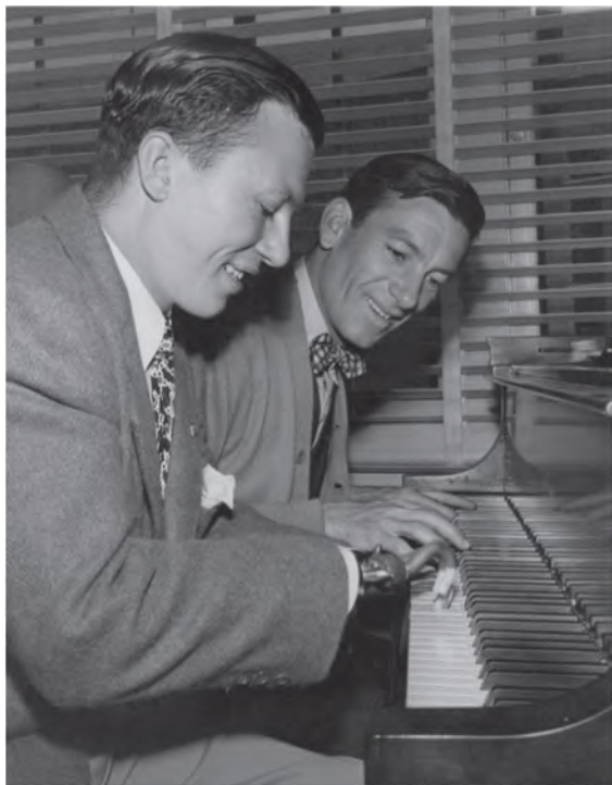
Илл. 13. Безрукий моряк учится играть на пианино