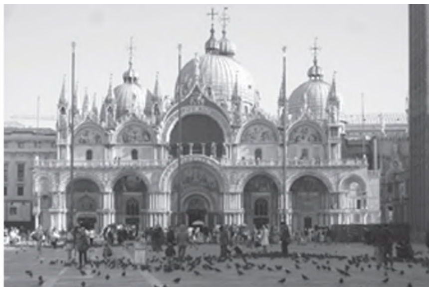
Илл. 3. Собор Святого Марка (Венеция, Италия)