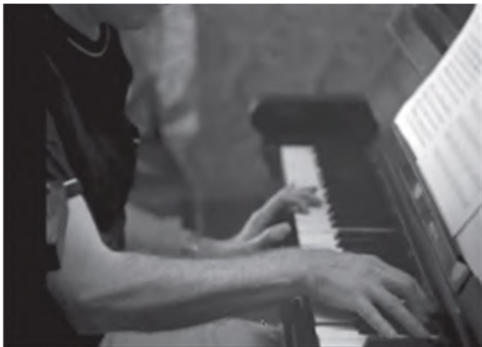
Илл. 20. «Я клавишей стаю кормил с руки...»