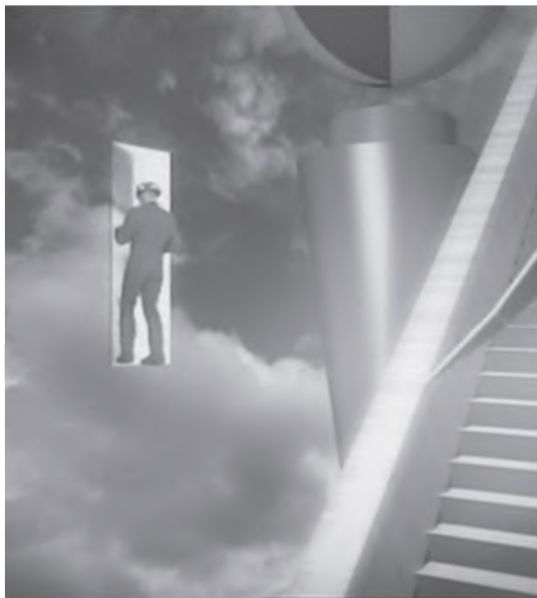
"Go West" (Pet Shop Boys)