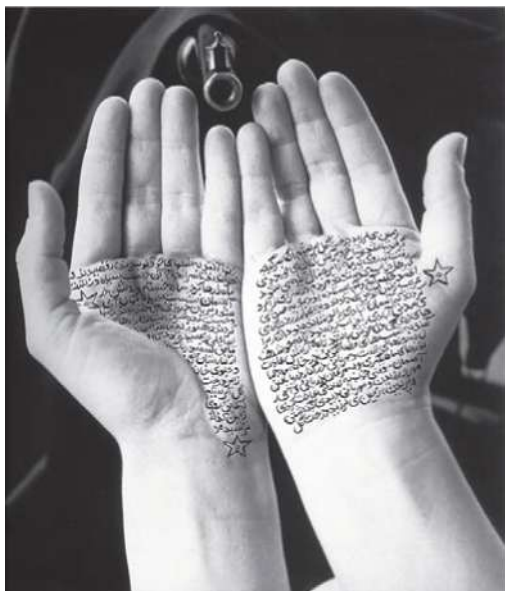
Илл. 7. Ширин Нешат “Guardians of revolution”